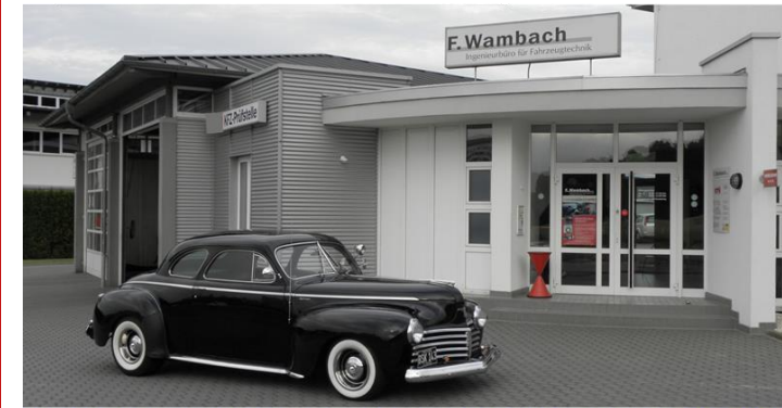
KFZ-Prüfstelle Wambach, Ingenieurbüro für Fahrzeugtechnik Christian-Kremp-Str. 9, 35578 Wetzlar, Tel. (06441) 7832-0, www.ib-wambach.de